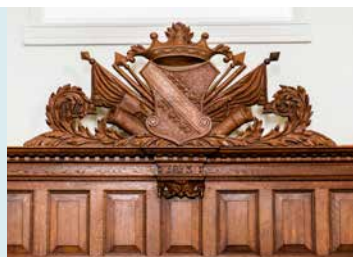
HERENBANK MET WAPEN VAN DE FAMILIE HEDDEMA, 1813

INTERIEUR In 1970 is de kerk grondig gerestaureerd. Hierbij is onder meer het meubilair uit het koorgedeelte weggehaald en is het koor het liturgisch centrum geworden. Tot 1825 was het algemeen gebruikelijk dat belangrijke personen in de kerk werden begraven. Daarna is dat bij wet verboden. Zo vinden we in het koor van de kerk diverse grafzerken . Er is ook een grafkelder te vinden.