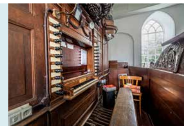
SPEELTAFEL MET ORGELBANK