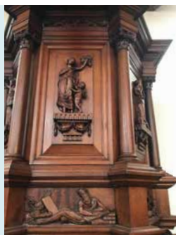
PREEKSTOEL MET ALLEGORISCHE VROUWEN FIGUREN, 1806