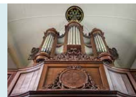
ORGELFRONT H.H.FREYTAGORGEL, 1808

Omdat het orgel zich, op de registerplaatjes na, in geheel originele staat bevindt en is gemaakt door een orgelmaker uit de beroemde Arp Schnitgerschool, is het een belangrijk orgel in de provincie Groningen.